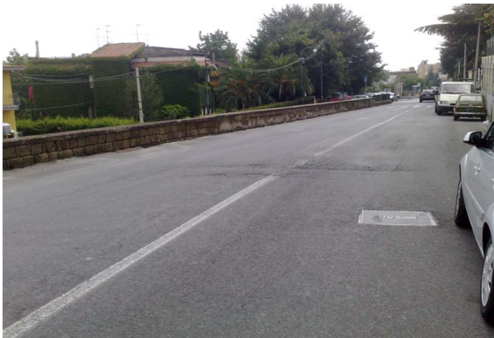
Via Orsolone ai Guantai