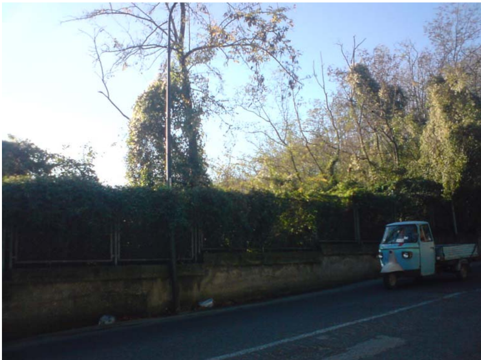
Via Orsolone ai Guantai

Saranno opportunamente ripristinate sia la segnaletica verticale, sia quella orizzontale.